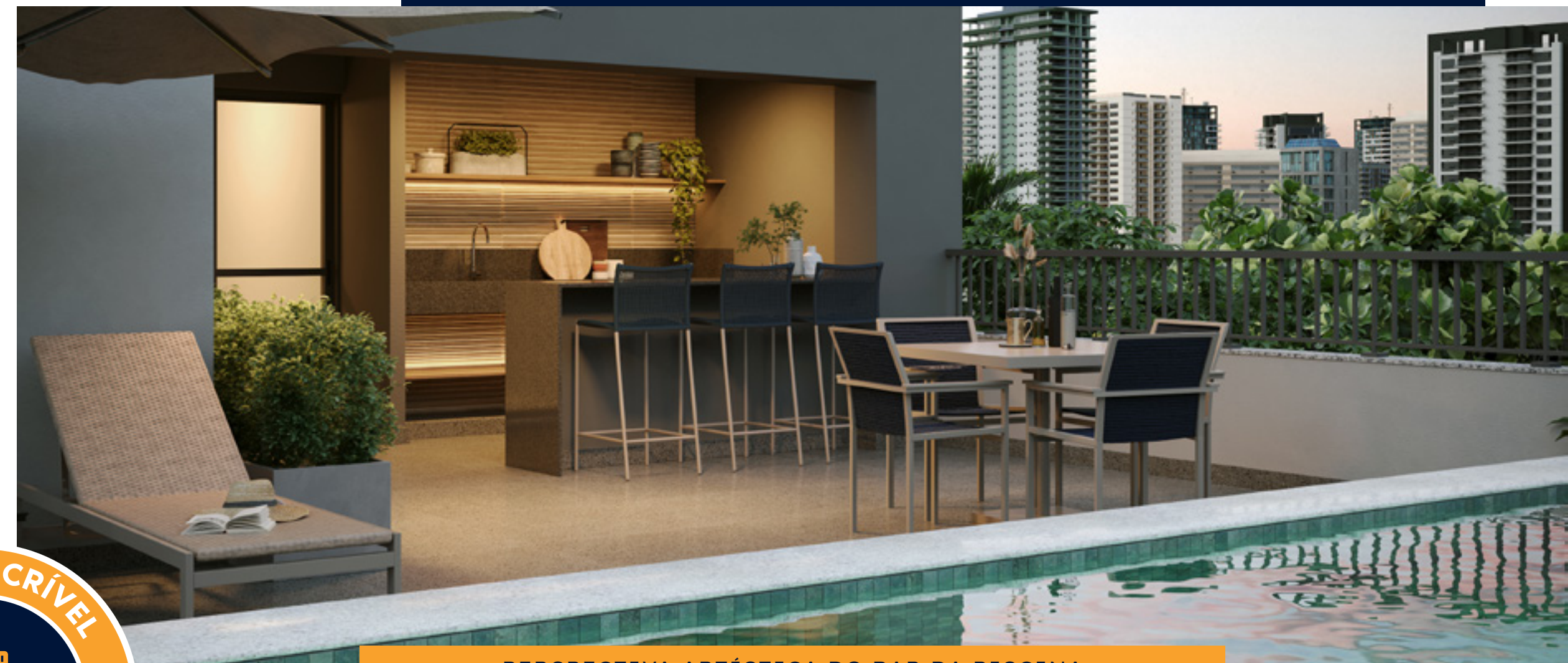
PERSPECTIVA ARTÍSTICA DO BAR DA PISCINA