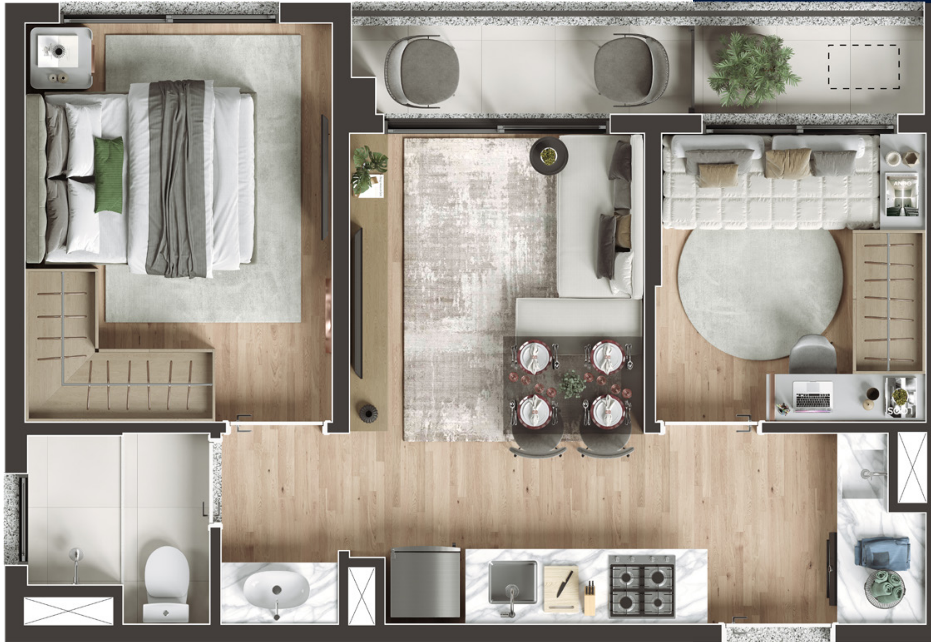
Ilustração artística do apartamento de 2 dormitórios com 39,06 m 2 - final 04. A sugestão de decoração, os móveis e utensílios são de dimensões comerciais e não fazem parte do contrato de compra e venda. Os revestimentos, bancadas, louças, metais e piso representados nas áreas do apartamento são mera sugestão de decoração e serão entregues conforme Memorial Descritivo do empreendimento. Medidas de eixo a eixo. Todos os itens serão entregues conforme Memorial Descritivo dos apartamentos.