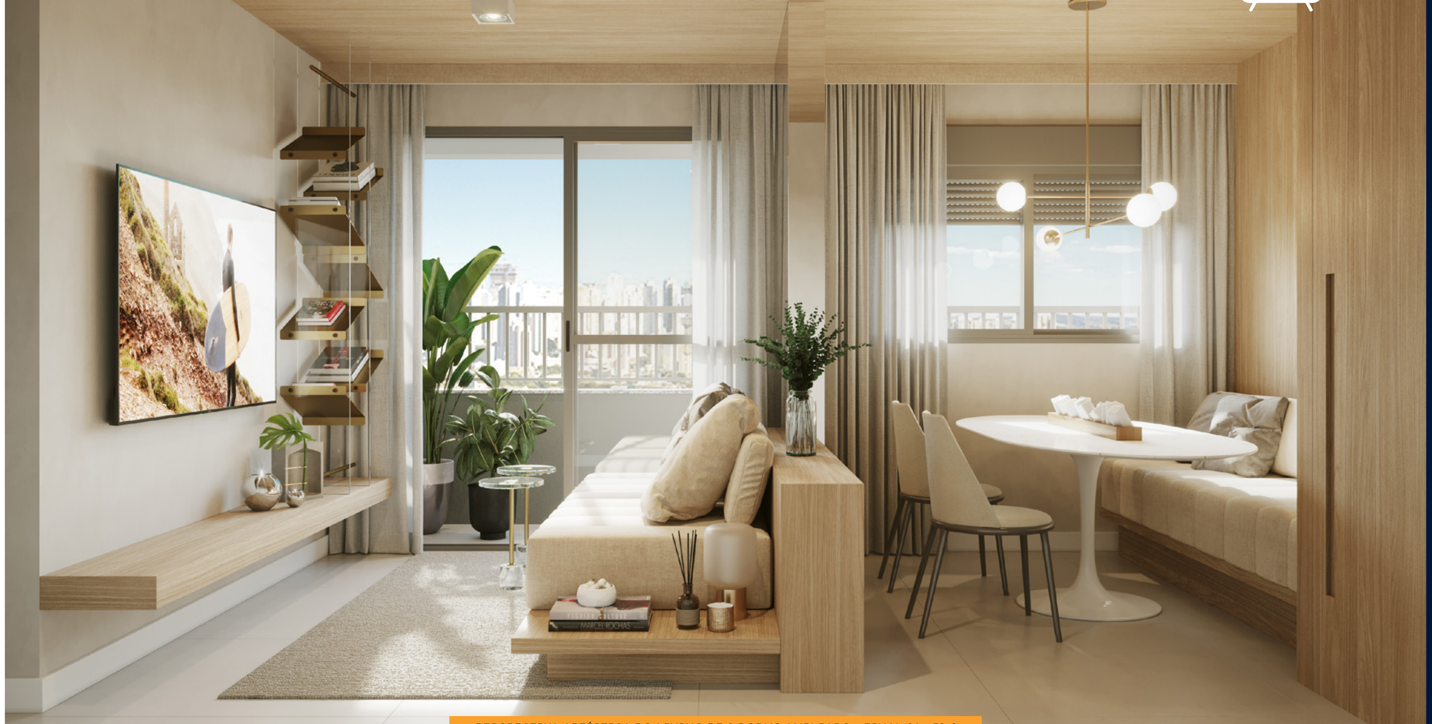
PERSPECTIVA ARTÍSTICA DO LIVING DE 2 DORMS AMPLIADO - FINAL 04 - 39M 2