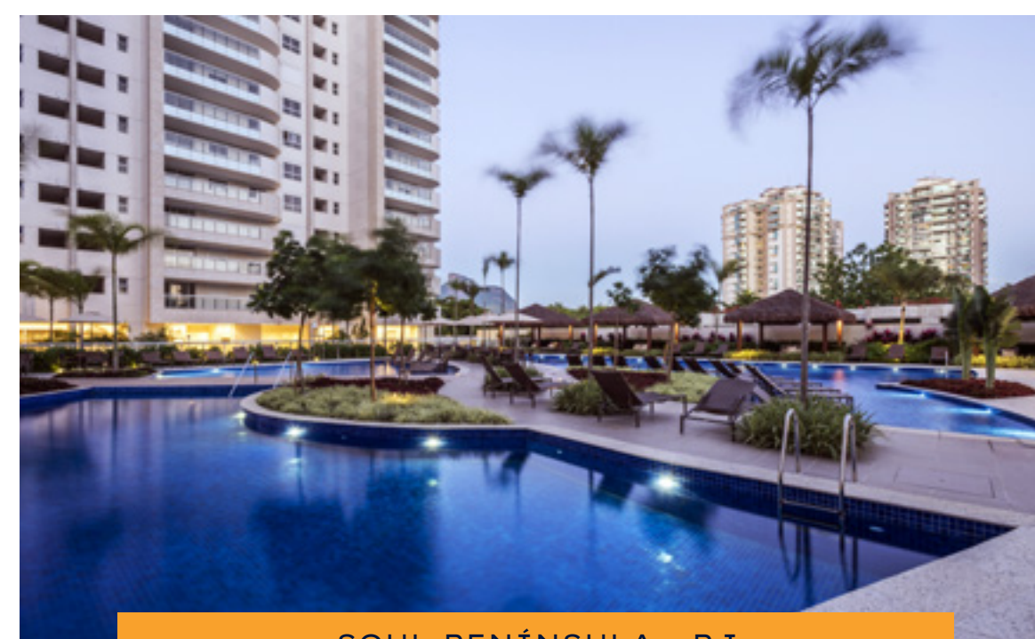
SOUL PENÍNSULA - RJ