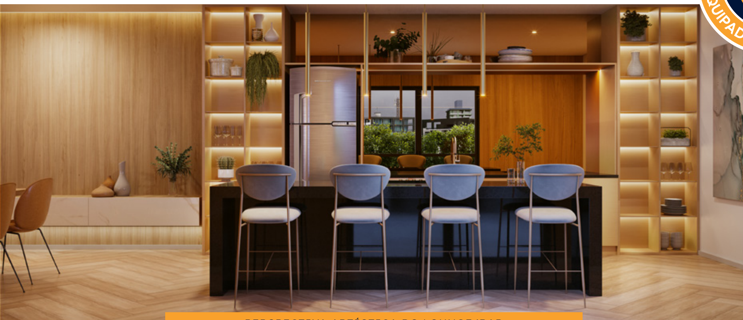
PERSPECTIVA ARTÍSTICA DO LOUNGE/BAR