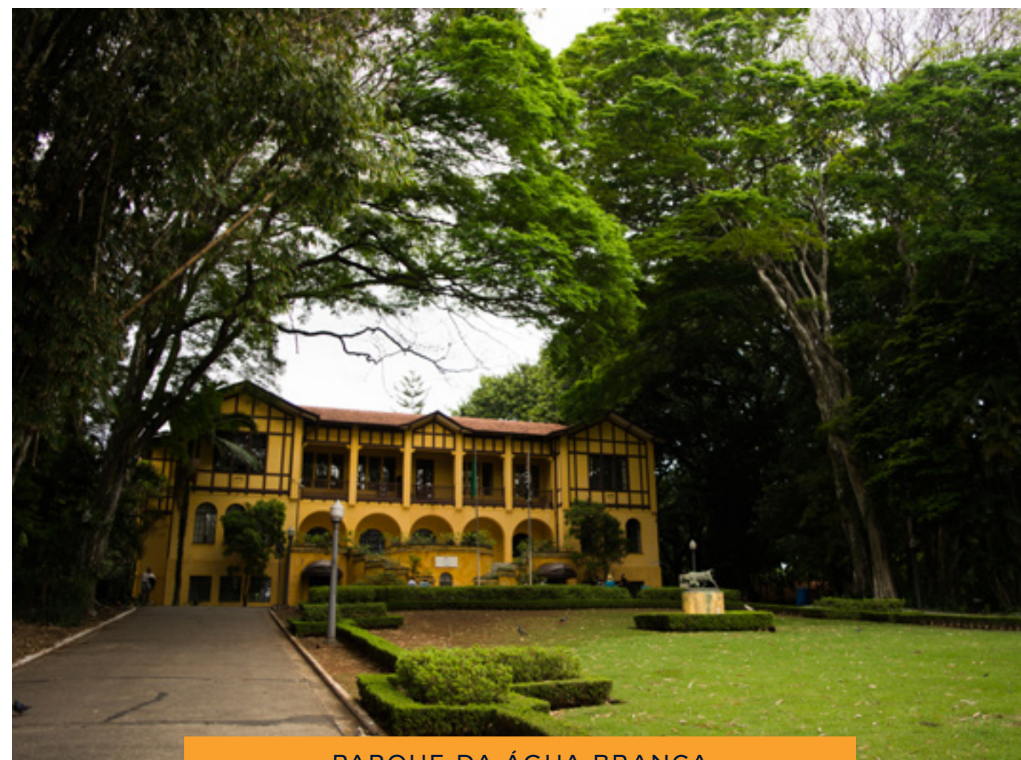
PARQUE DA ÁGUA BRANCA