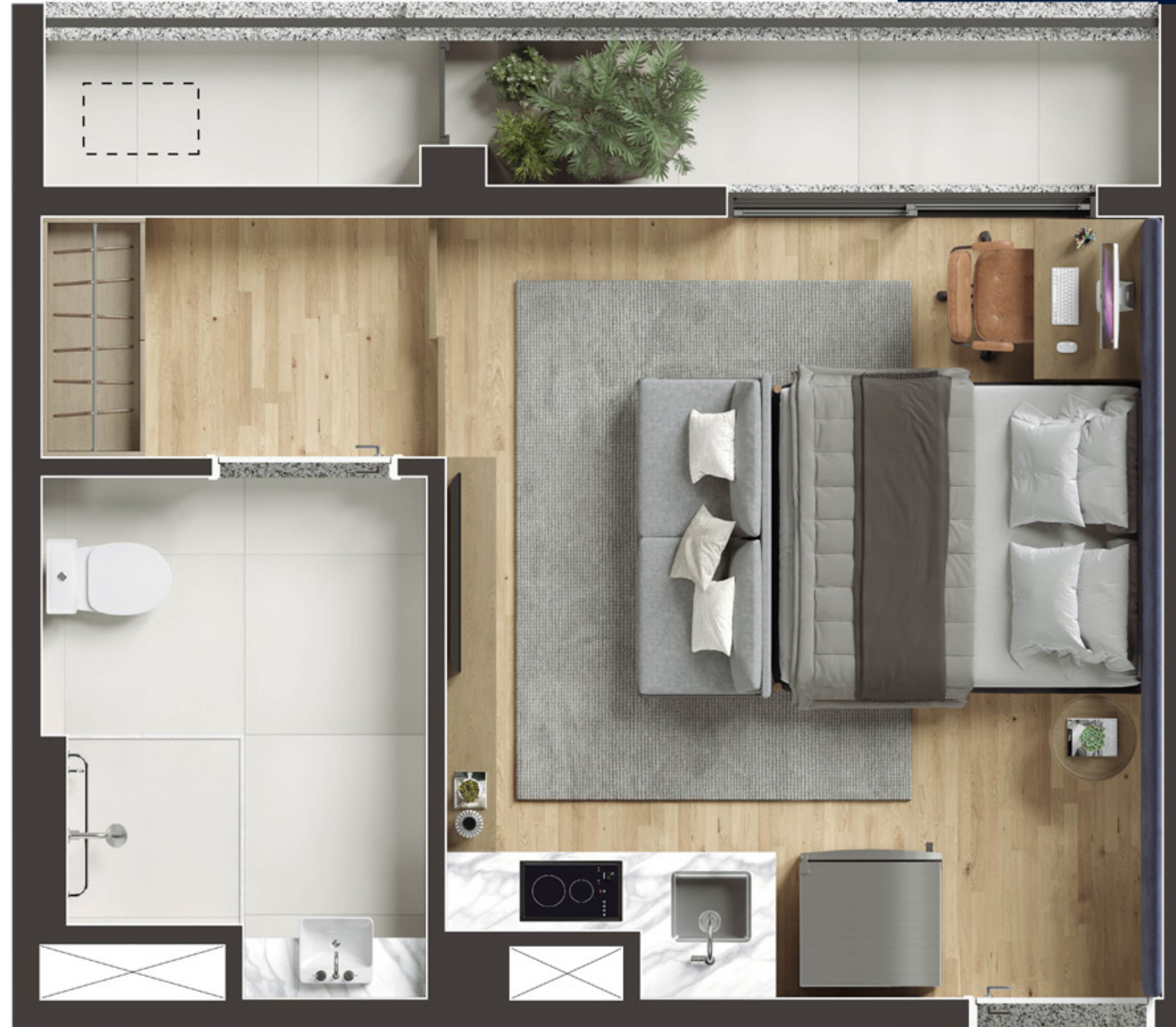
PLANTA DO STUDIO NR - FINAL 10 - 29M 2

Ilustração artística do Apartamento Studio NR com 28,97 m 2 - final 10. A sugestão de decoração, os móveis e utensílios são de dimensões comerciais e não fazem parte do contrato de compra e venda. Os revestimentos, bancadas, louças, metais e piso representados nas áreas do apartamento são mera sugestão de decoração e serão entregues conforme Memorial Descritivo do empreendimento. Medidas de eixo a eixo. Todos os itens serão entregues conforme Memorial Descritivo dos apartamentos.