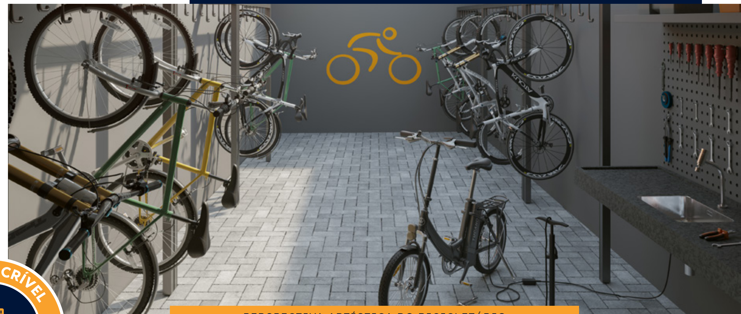
PERSPECTIVA ARTÍSTICA DO BICICLETÁRIO