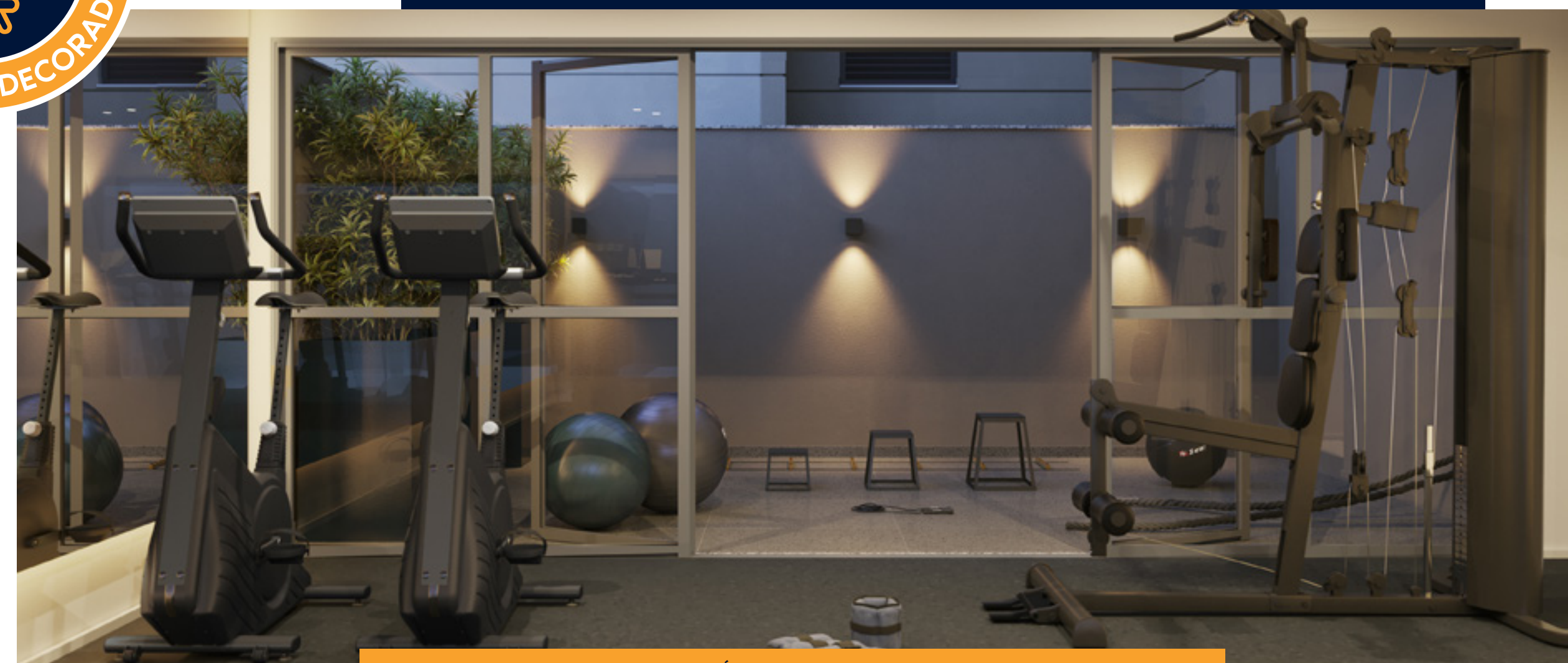
PERSPECTIVA ARTÍSTICA DO FITNESS EXTERNO