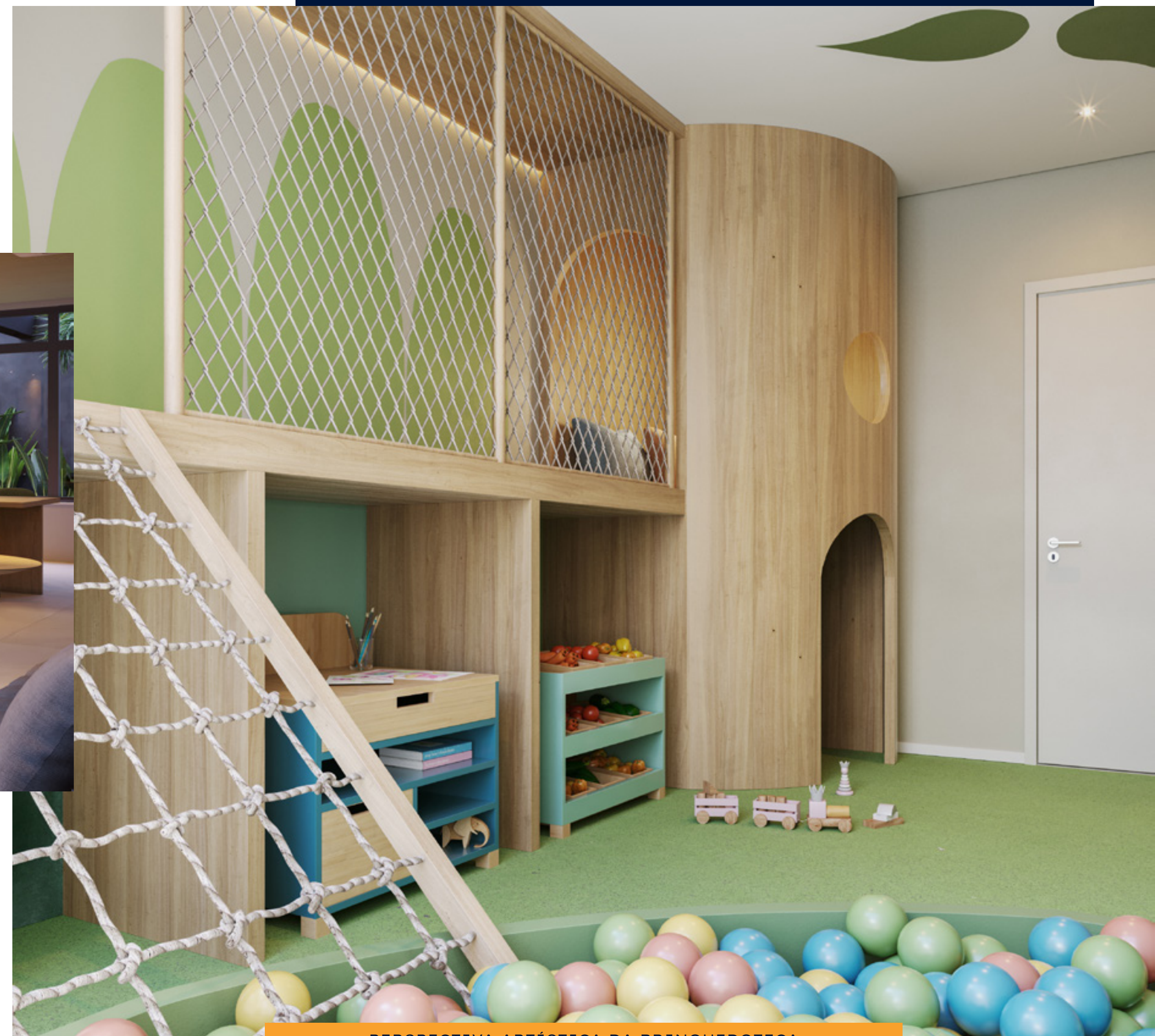
PERSPECTIVA ARTÍSTICA DA BRINQUEDOTECA