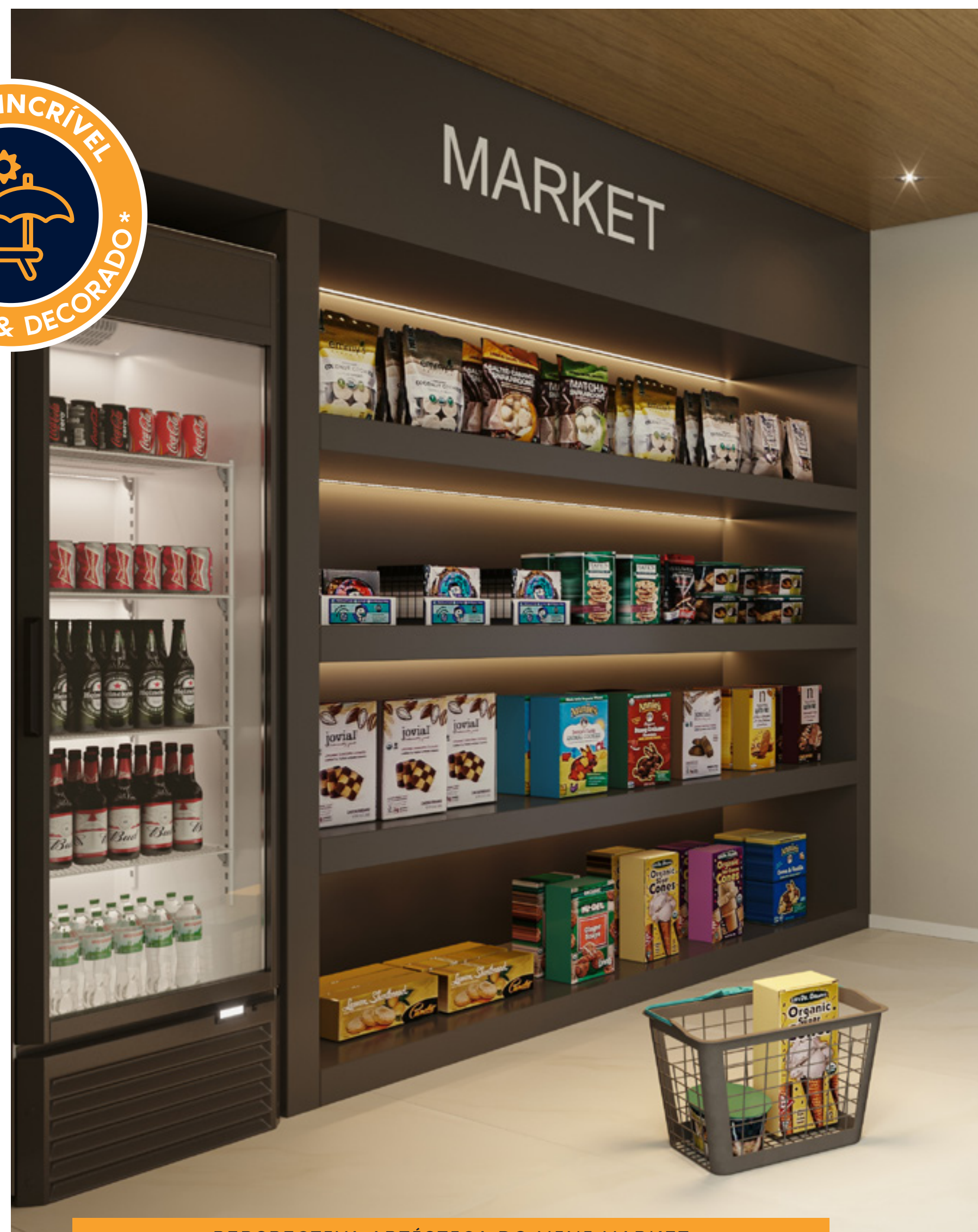
PERSPECTIVA ARTÍSTICA DO MINI MARKET