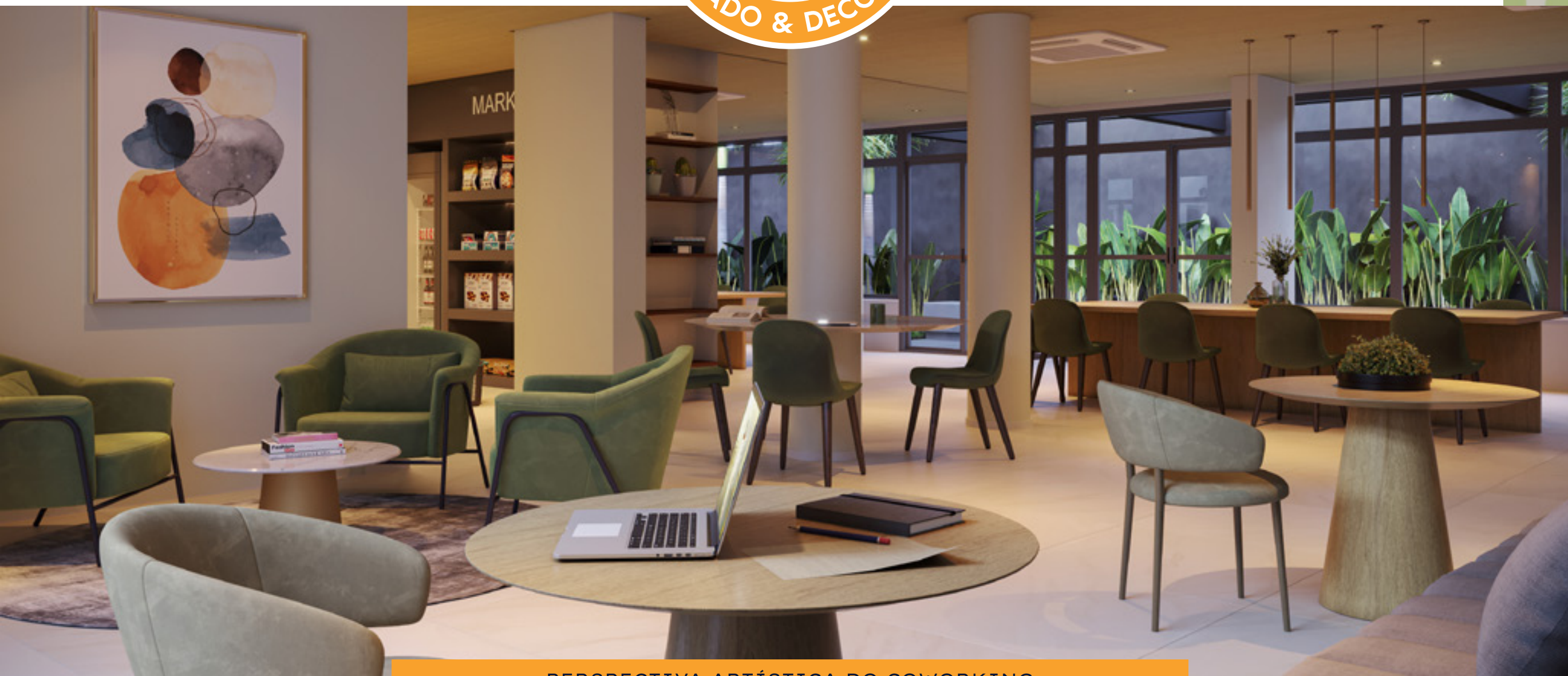
PERSPECTIVA ARTÍSTICA DO COWORKING