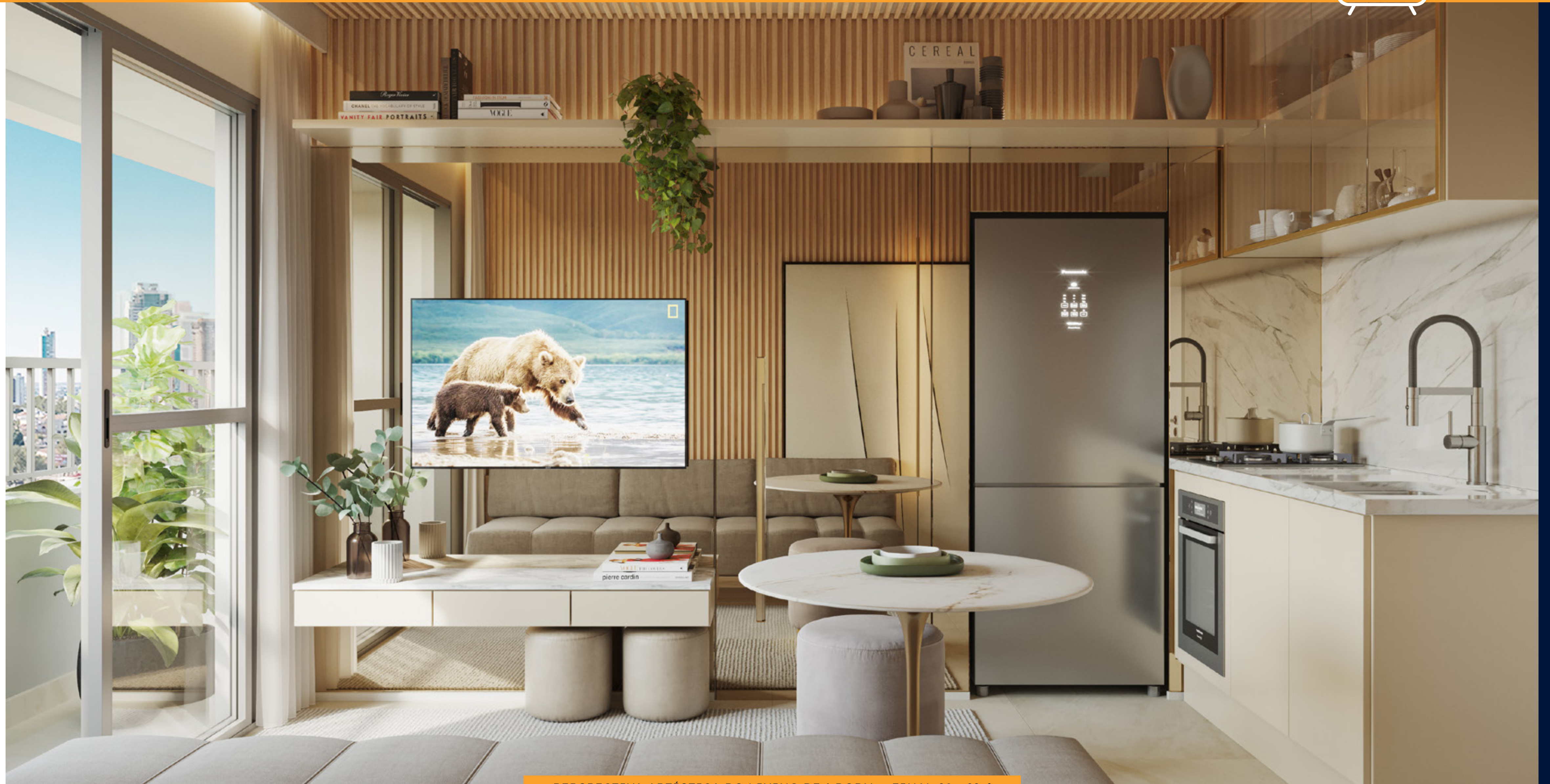
PERSPECTIVA ARTÍSTICA DO LIVING DE 1 DORM - FINAL 08 - 29M 2