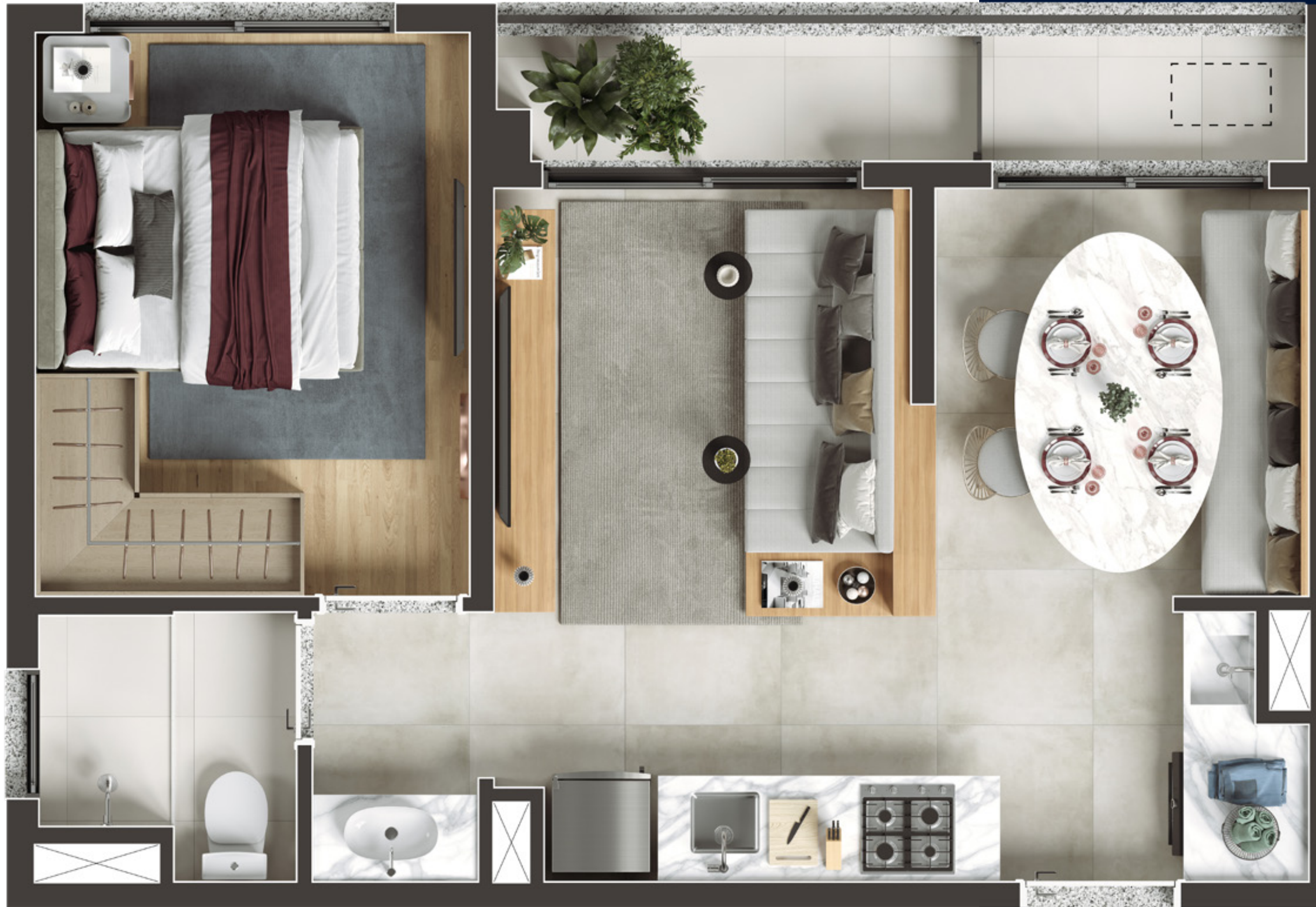
Ilustração artística do apartamento de 2 dormitórios - Living Ampliado - com 39,06 m 2 - final 04. A sugestão de decoração, os móveis e utensílios são de dimensões comerciais e não fazem parte do contrato de compra e venda. Os revestimentos, bancadas, louças, metais e piso representados nas áreas do apartamento são mera sugestão de decoração e serão entregues conforme Memorial Descritivo do empreendimento. Medidas de eixo a eixo. Todos os itens serão entregues conforme Memorial Descritivo dos apartamentos.