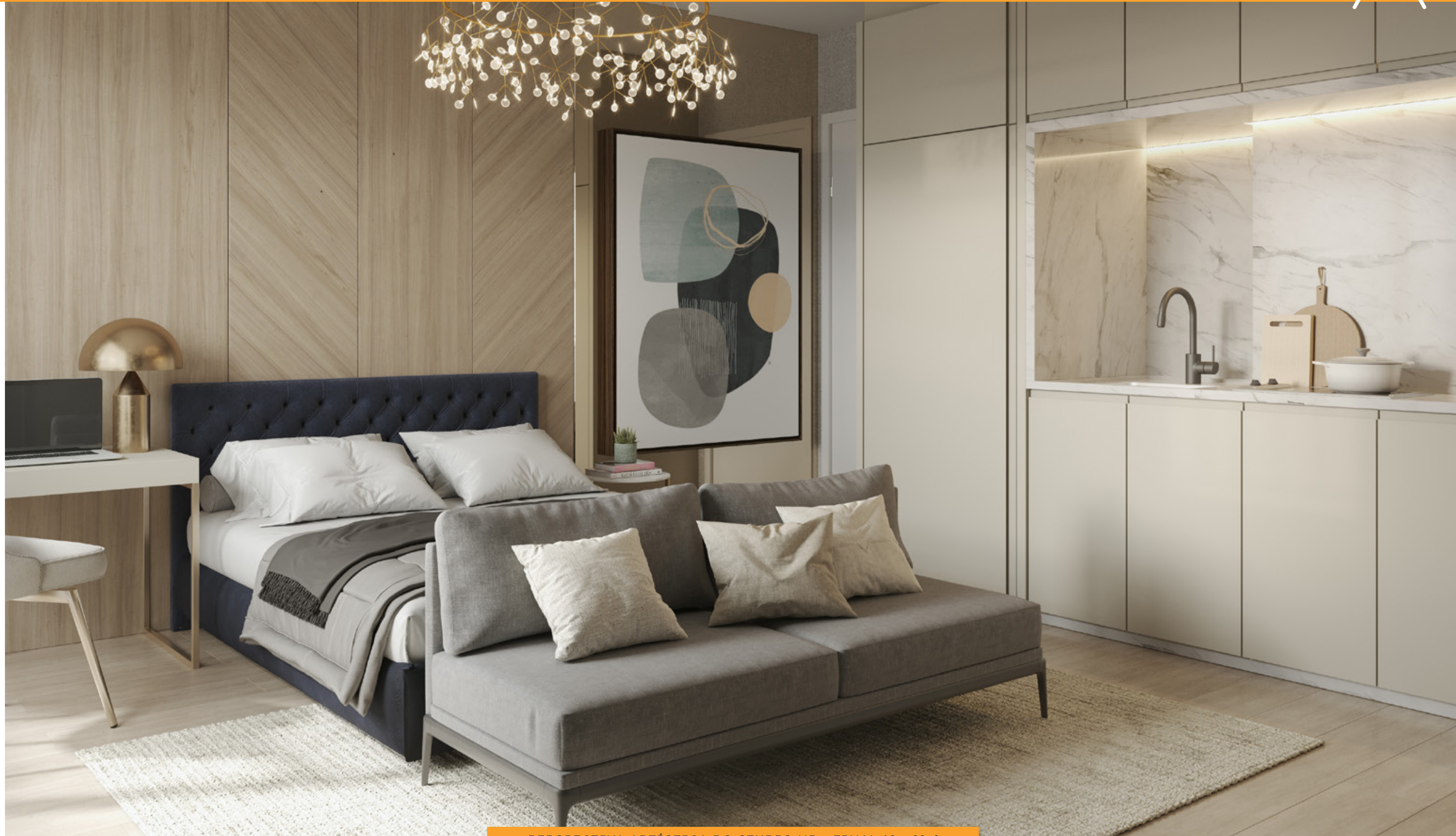
PERSPECTIVA ARTÍSTICA DO STUDIO NR - FINAL 10 - 29M 2