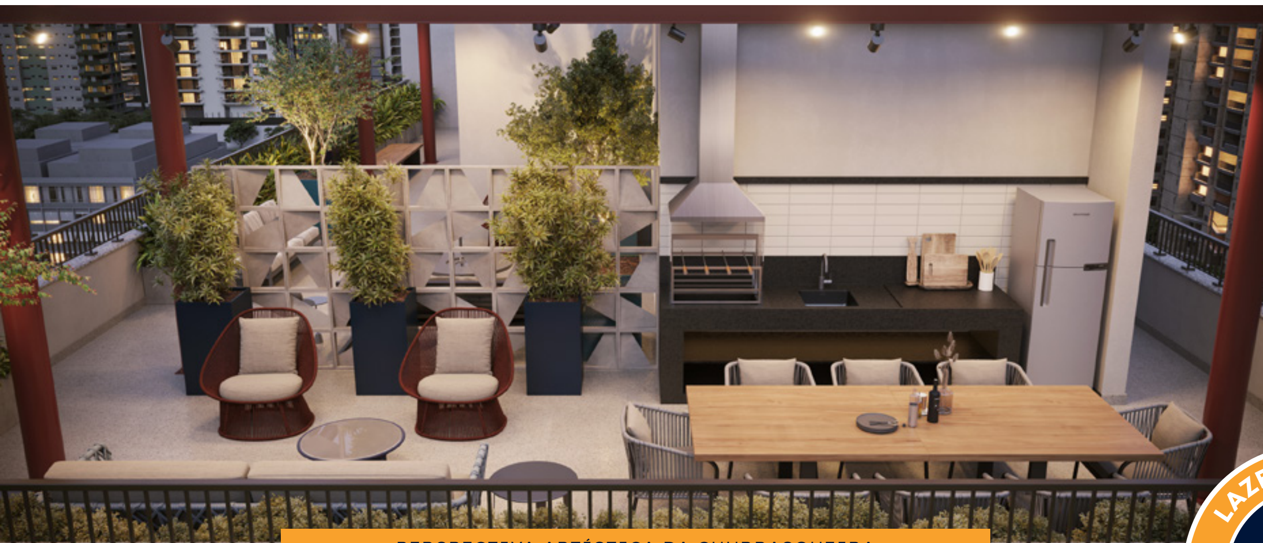
PERSPECTIVA ARTÍSTICA DA CHURRASQUEIRA

*As imagens são meramente ilustrativas. Todos os ambientes serão entregues conforme memorial descritivo.