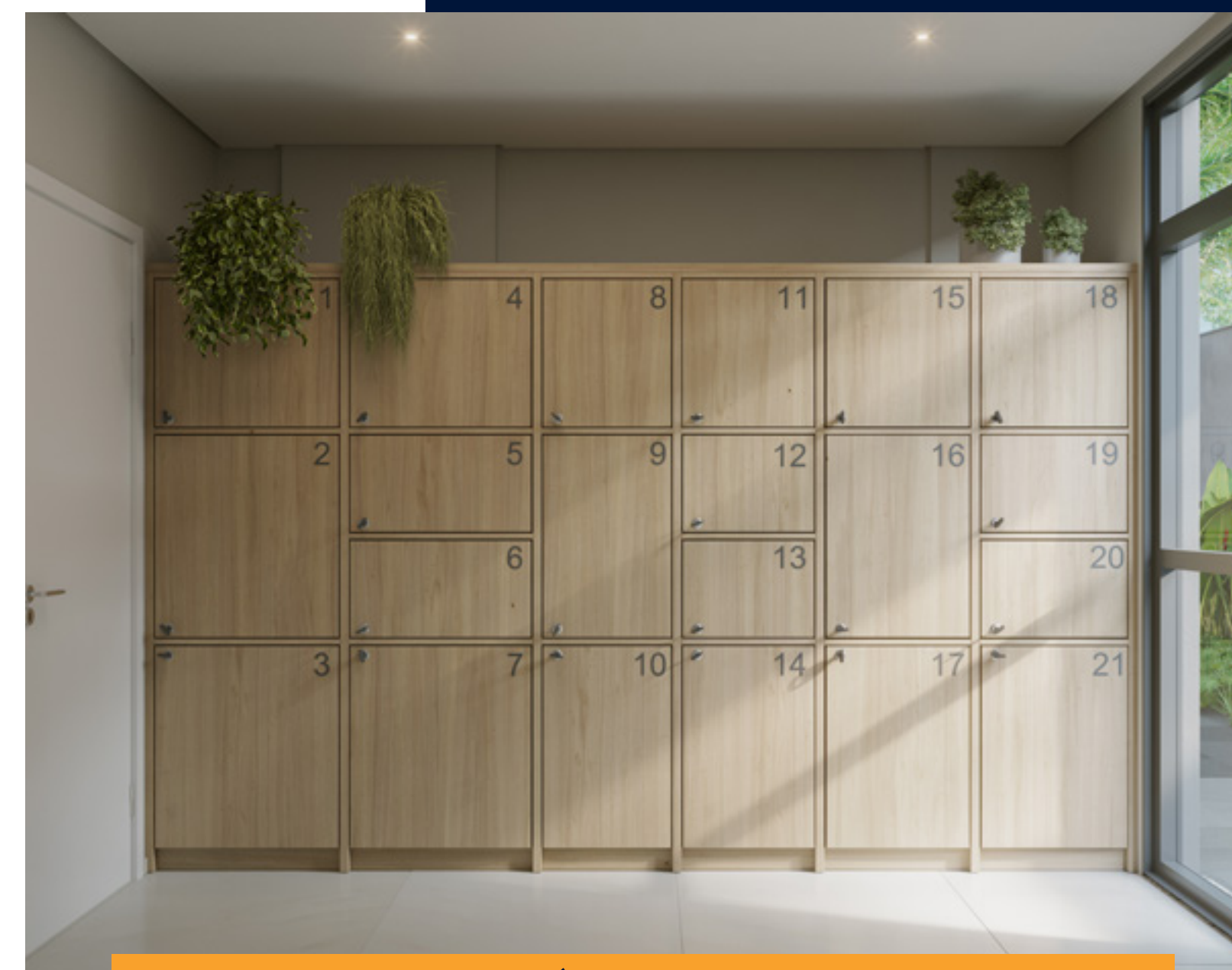
PERSPECTIVA ARTÍSTICA DO ESPAÇO DELIVERY