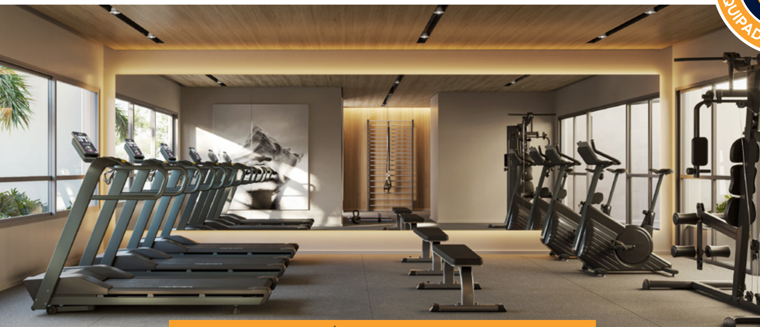
PERSPECTIVA ARTÍSTICA DO FITNESS RESIDENCIAL