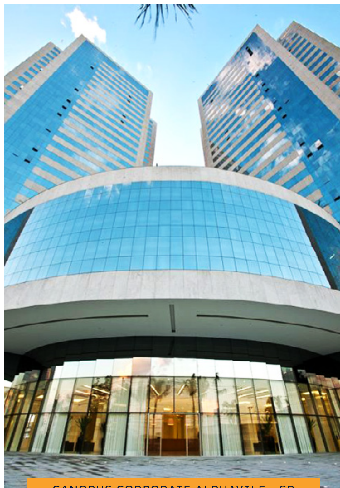
CANOPUS CORPORATE ALPHAVILE - SP

Através de setores e equipes multidisciplinares, somos capazes de exercer com excelência nosso papel.