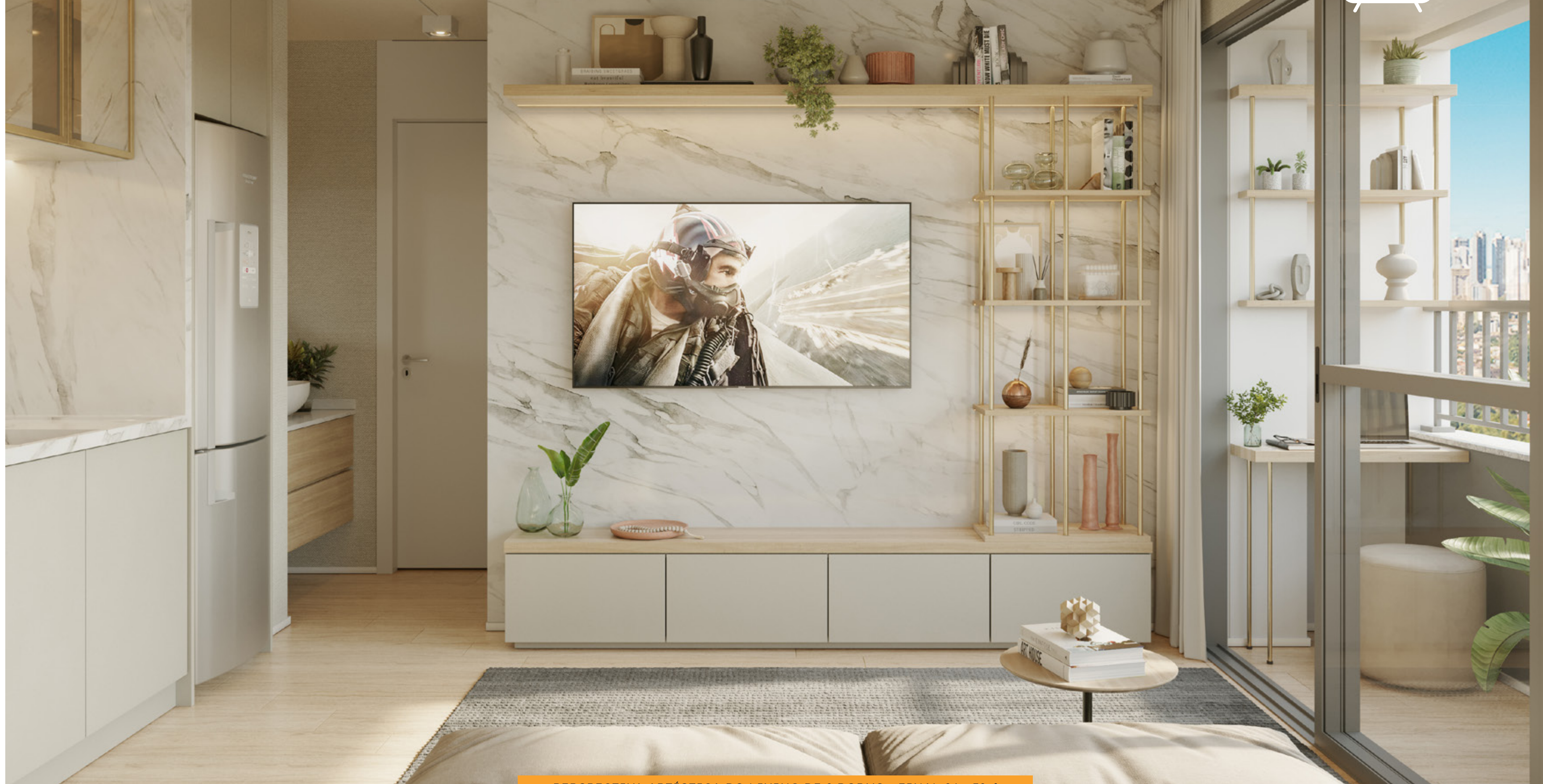
PERSPECTIVA ARTÍSTICA DO LIVING DE 2 DORMS - FINAL 04 - 39M 2