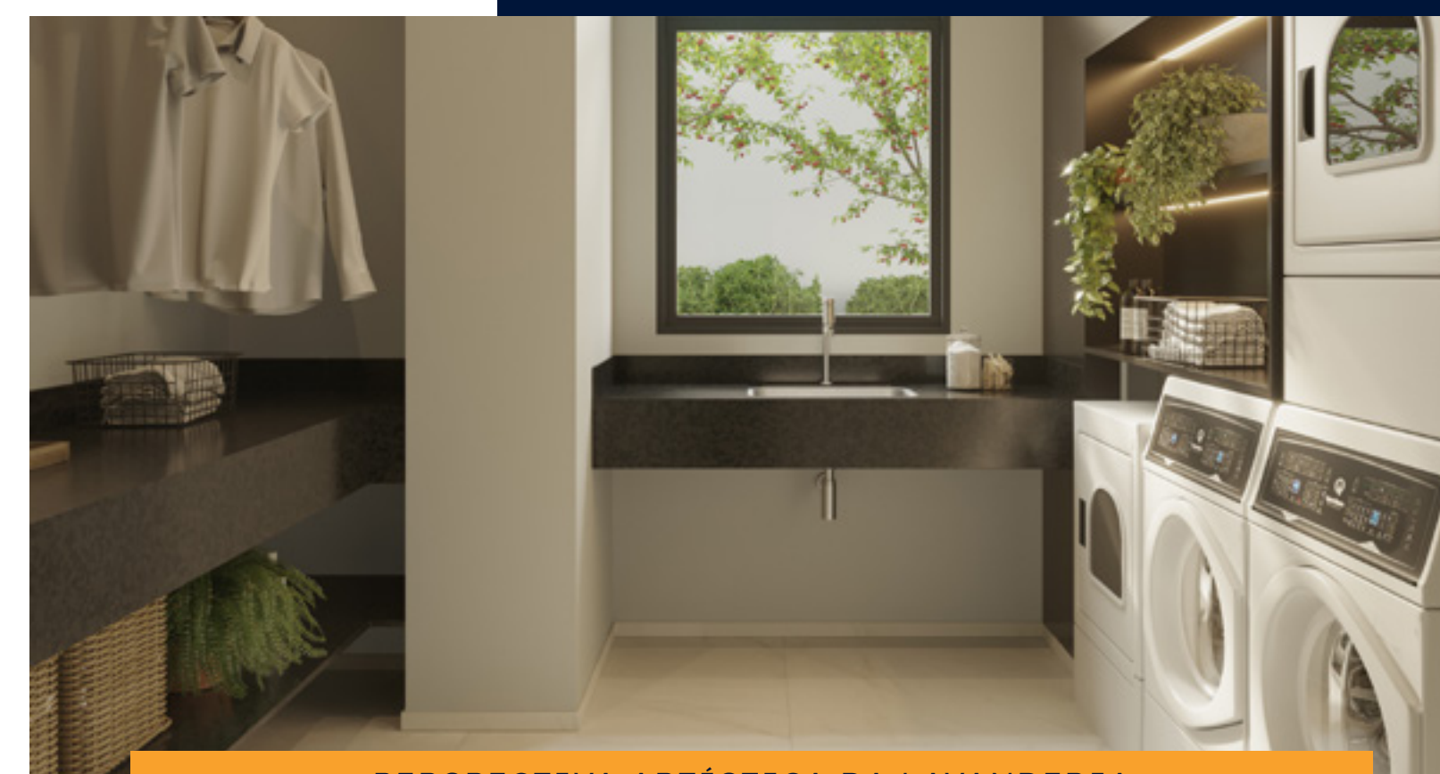
PERSPECTIVA ARTÍSTICA DA LAVANDERIA