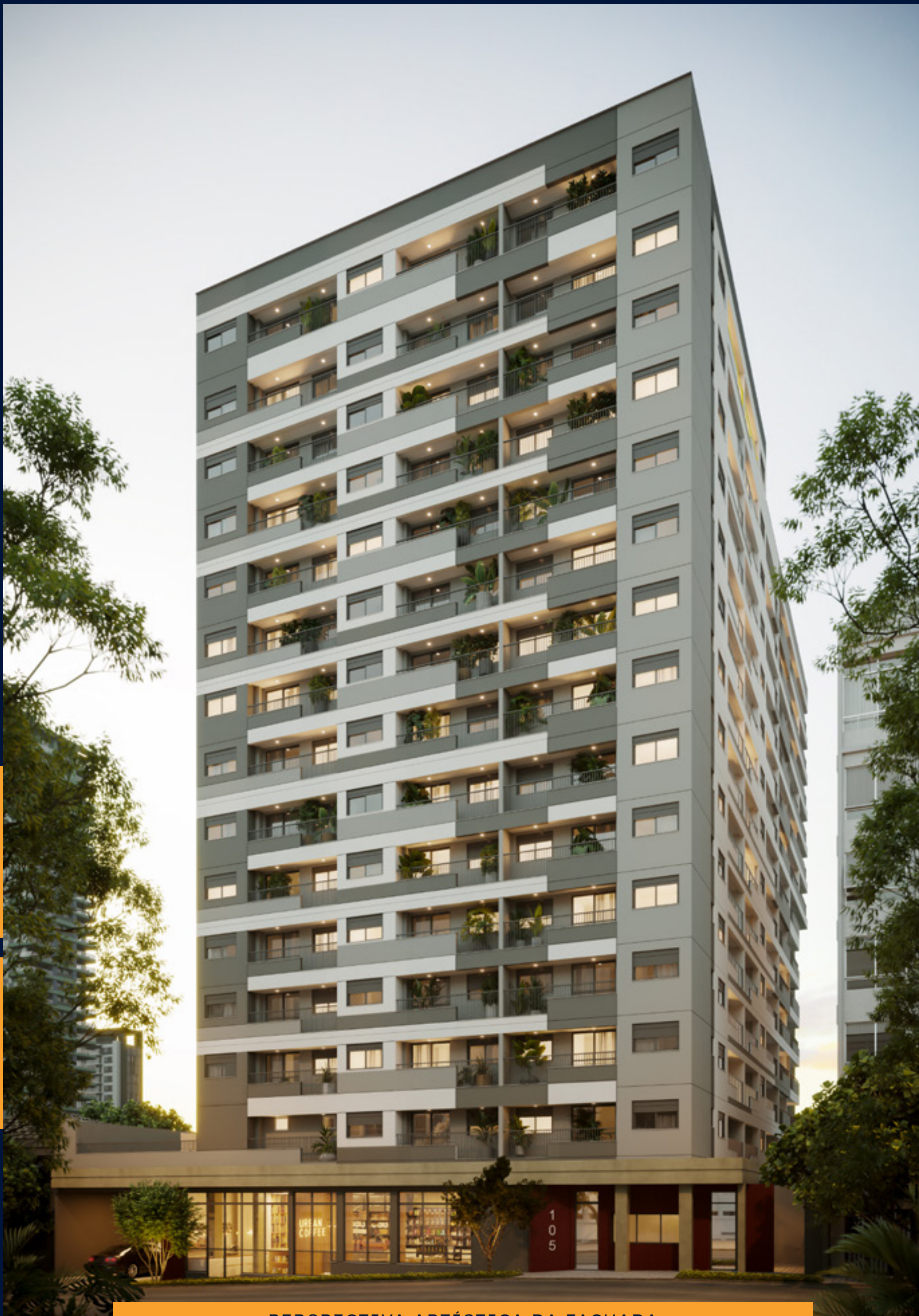
PERSPECTIVA ARTÍSTICA DA FACHADA