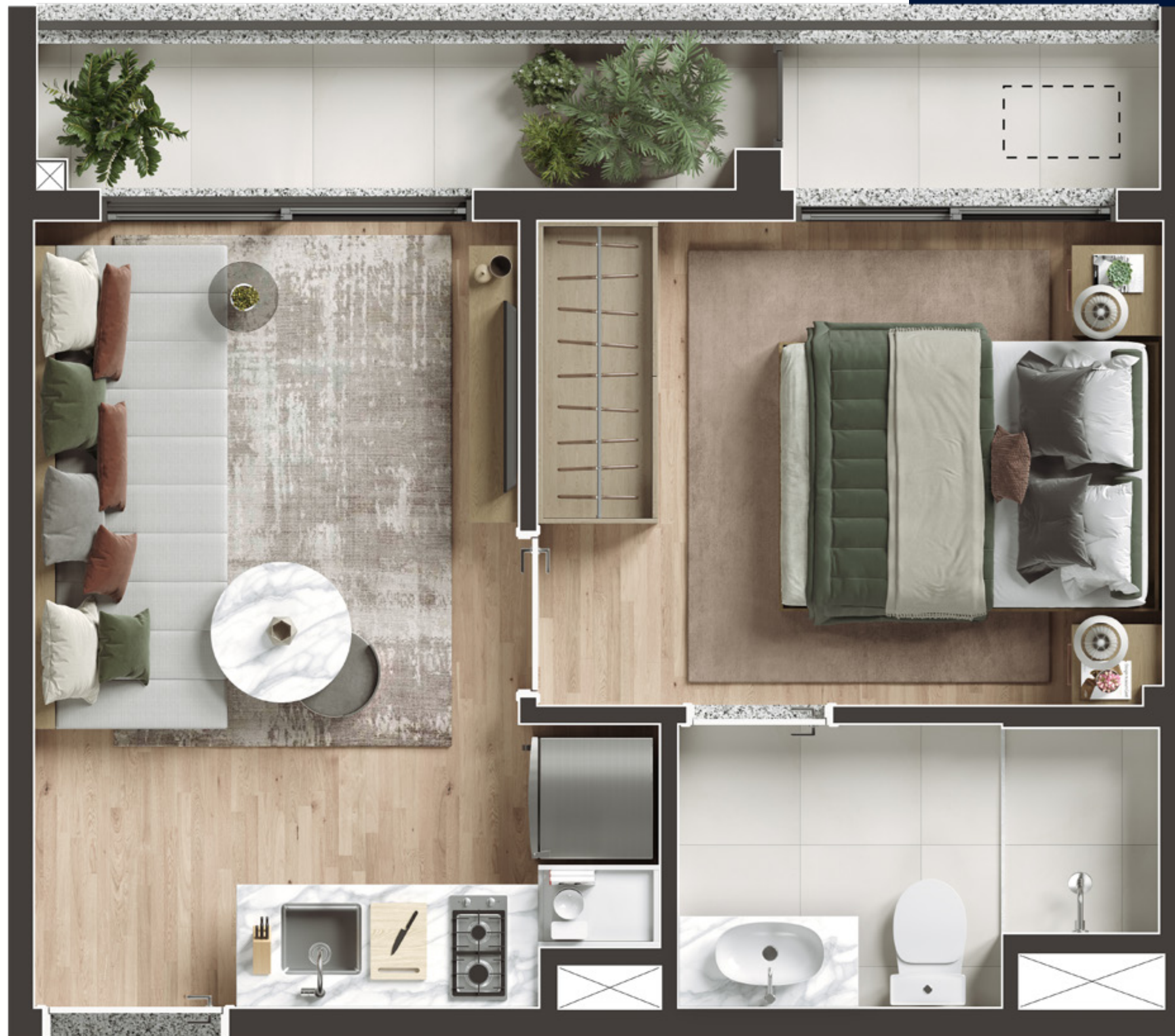
PLANTA DO APARTAMENTO DE 1 DORM - FINAL 08 - 29M 2

Ilustração artística do apartamento de 1 dormitório com 29,33 m 2 - final 08. A sugestão de decoração, os móveis e utensílios são de dimensões comerciais e não fazem parte do contrato de compra e venda. Os revestimentos, bancadas, louças, metais e piso representados nas áreas do apartamento são mera sugestão de decoração e serão entregues conforme Memorial Descritivo do empreendimento. Medidas de eixo a eixo. Todos os itens serão entregues conforme Memorial Descritivo dos apartamentos.