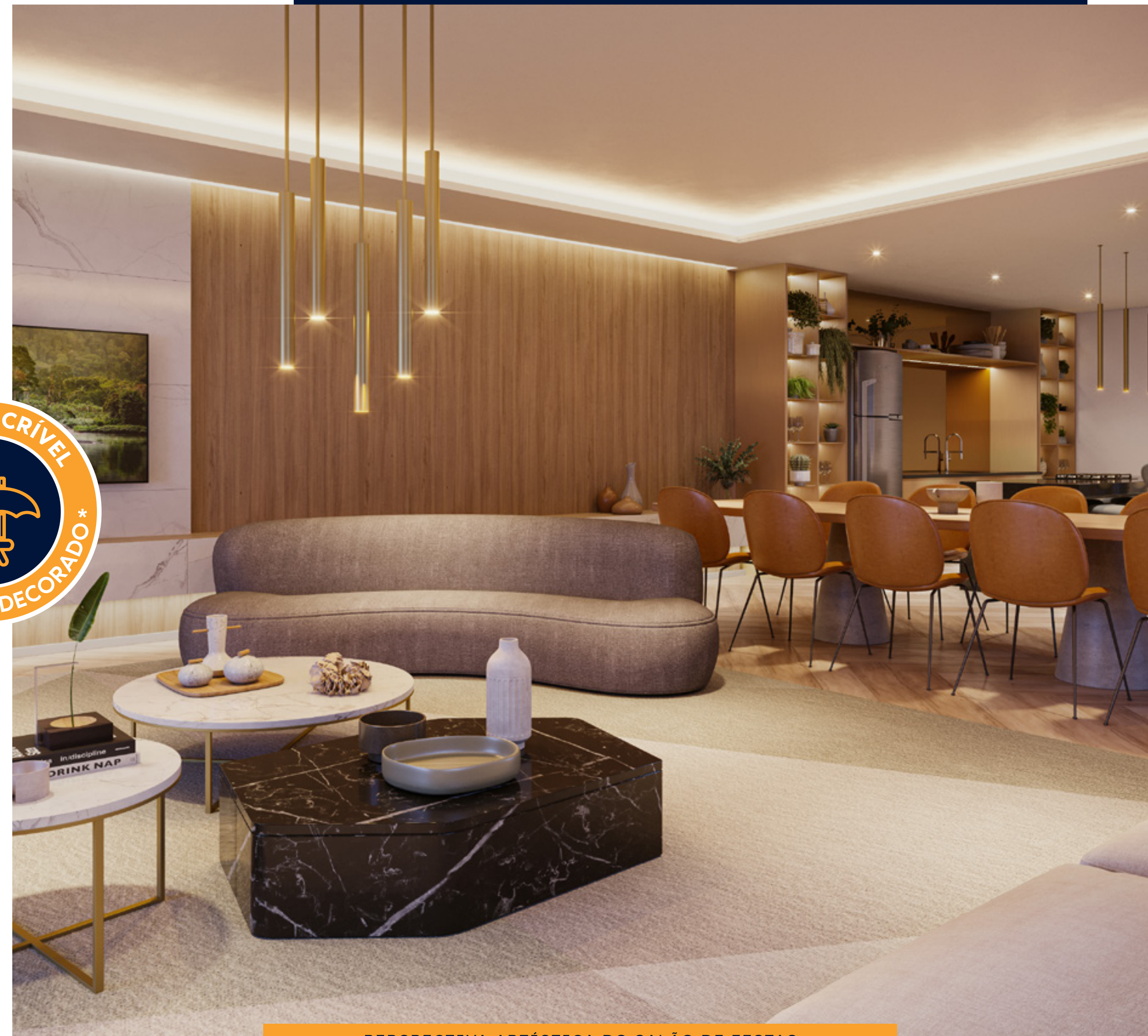
PERSPECTIVA ARTÍSTICA DO SALÃO DE FESTAS