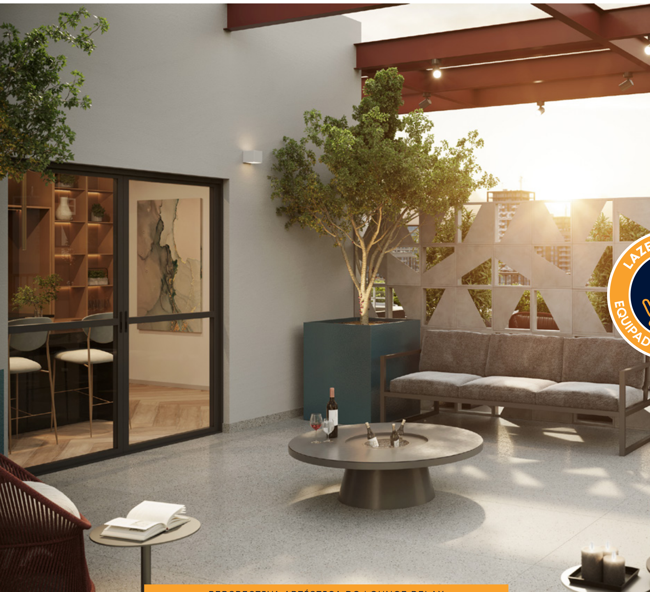
PERSPECTIVA ARTÍSTICA DO LOUNGE RELAX

*As imagens são meramente ilustrativas. Todos os ambientes serão entregues conforme memorial descritivo.